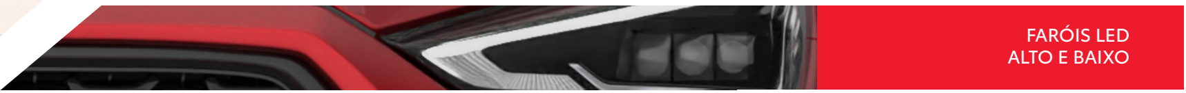
FARÓIS LED ALTO E BAIXO