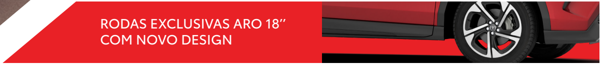
RODAS EXCLUSIVAS ARO 18" COM NOVO DESIGN