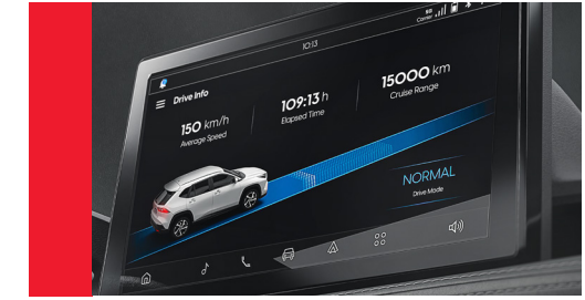
MULTIMÍDIA TOYOTA PLAY com conexão Android Auto e Apple CarPlay, tela sensível ao toque de 10" e projeção da câmera de ré 360°