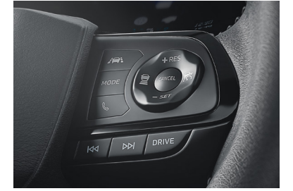
VOLANTE COM CONTROLES de áudio, computador de bordo e funções Toyota Safety Sense