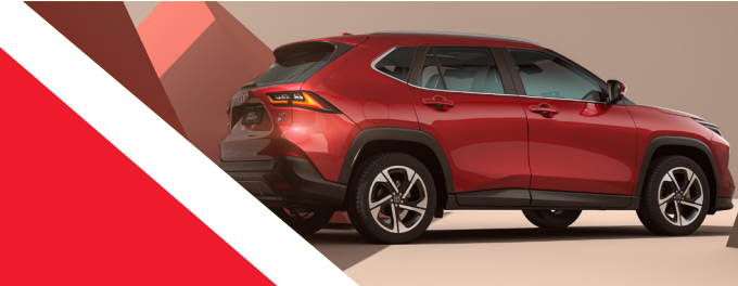
DESIGN ROBUSTO E DINÂMICO