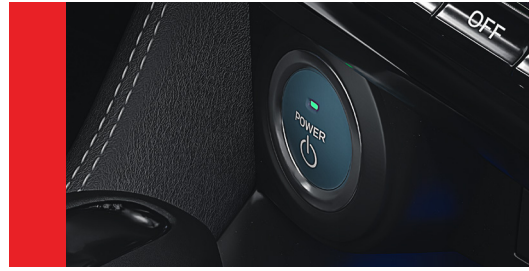
START BUTTON / PUSH START Sistema de partida por botão (sem chave)