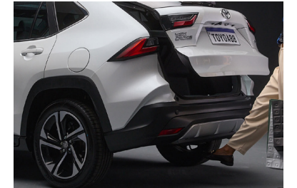
ABERTURA ELETRÔNICA do porta-malas com sensor de presença e capacidade de até 400 litros