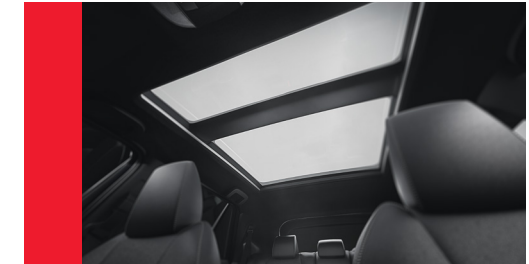
TETO PANORÂMICO FIXO EM VIDRO