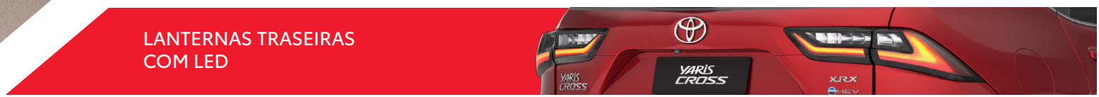
LANTERNAS TRASEIRAS COM LED