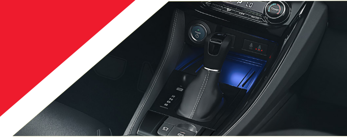
CARREGADOR DE CELULAR sem fio ou por indução