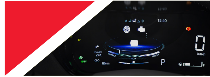
PAINEL DE INSTRUMENTOS Tela TFT 9 de 7"